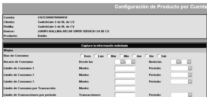
Pantalla Configuración de Producto por Cuenta

Se muestra la pantalla Configuración de Producto por Cuenta con los productos (Magna, Premium, Aceites/Lubricantes, Disposición de Efectivo), con los siguientes campos para c/u de ellos: